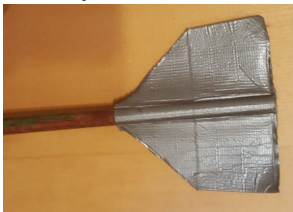
moje letky ze sportpásky a čtvrtky, věřím že se vám povedou hezčí