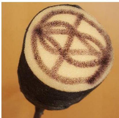
Označení mých šípů, ne že se budete opičit! :-)

Vzhledem k tomu že většina šípů a šipek vychází ze stejných materiálů, vypadají podobně. Je proto nutné si je nějak označit, abychom je dokázali poznat od ostatních. Vhodným řešením je například nakreslit nějaký symbol na hlavici (týblo se může zlomit/upadnout a s ním i označení které bychom na něj umístili).