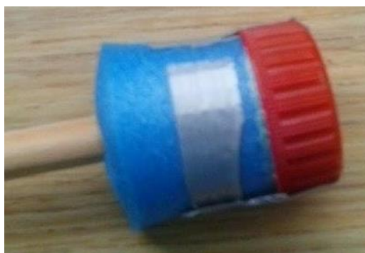
jádro hlavice z PET víčka

Tento typ můžeme najít na starších šípkách. Nové šipky s touto hlavicí (prosím) nevyrábějte, ostatní typy hlavic jsou bezpečnější. Pevné jádro je tvořeno PET víčkem. Samotné týblo by na něm nedrželo, proto ho nejdřív obmotáme kobercem či karimatkou tak aby výsledný tvar vyplnil víčko a následně ho do víčka vlepíme. V žádném případě nepřibijíme víčko k týblu hřebíkem.