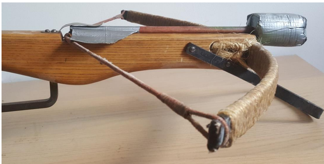
optimální délka šípky vzhledem ke kuši - hlavice začíná cca tam, kde kuše končí

Délka šípky je určena velikostí kuše – volíme ji tak, aby u šípky založené do kuše hlavice začínala téměř tam, kde končí kuše - kratší šípku nejde pořádně založit, delší se plete.