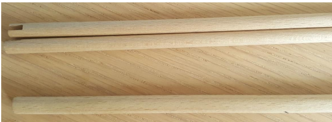
tloušťka týbel na šíp (nahore) vs tloušťka týbla na šípku(dole)

Týbla šipek jsou kratší a tlustší než týbla šípů, a díky tomu jsou výrazně odolnější vůči zlomení. Na šípky se typicky používají dřevěná týbla o průměru 10 mm – větší průměr je nutný kvůli tomu, že šípky nezakládáme do tětiny. I u šipek je alternativou laminátové týblo, nicméně vzhledem k malé lámavosti dřevěných šipek není důvod jej používat. Pokud byste se i tak rozhodli pro laminátové týblo, je nutné zvolit větší průměr (minimálně 8 mm, lépe 10 mm a postupovat jako v případě laminátového šípu co se týče obalení).