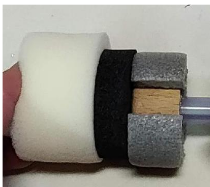
jednotlivé části hobití hlavice s dřevěným jádrem

Na video se sestavováním těchto hlavice se můžete podívat například zde: https://www.youtube.com/watch?v=oQxBXKBw5Jo , s drobnou poznámkou, že místo oboustranné pásky lze použít i chemoprén.