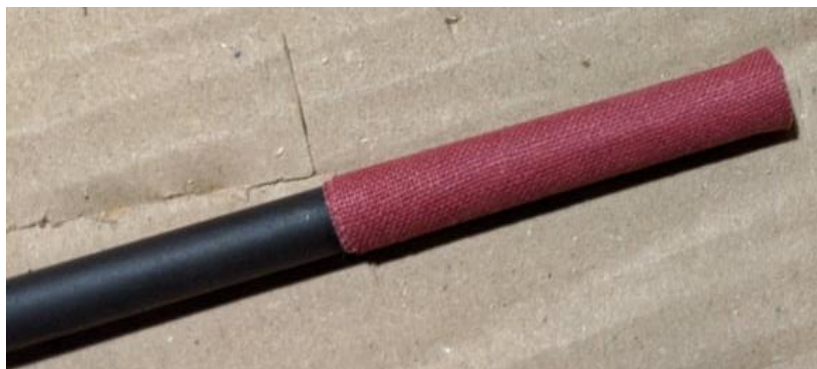
Laminátová týbla mívají menší průměr než standardní hlavice, a proto je potřeba jejich konce zesilovat

V každém případě musí být týblo pevně upevněné v jádru, nesmí se moc viklat ani vyjíždět (hlavice musí zůstat nasazená i v případě, že za ní trheme). Tomu můžeme pomoci zesílením týbla kobercpáskou jako u obrázku níže, nebo vlepením týbla do jádra.