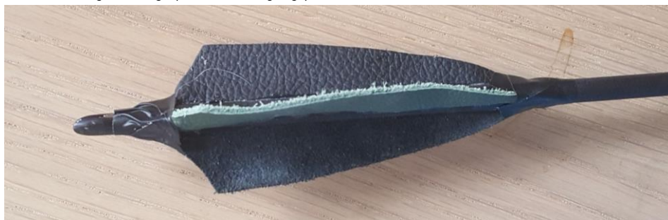
kožené letky z hůrky, protože jsou na šípku, jsou 3, na šípce by byly 2. zároveň zde vidíme končík který na šípce není