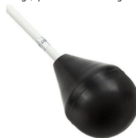
Šíp na archery tag